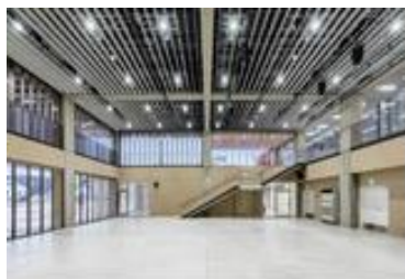
イベントスペース